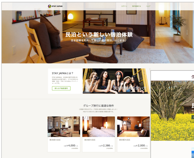
「STAY JAPAN」サービス提供サイト