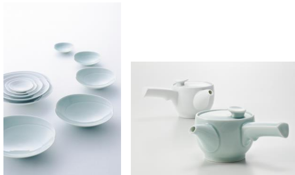
▲店舗で使用する波佐見焼のイメージ