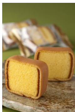
▲店舗で提供するお菓子の一例「カステラ巻」

▲GREEN TEA WORLD USA, Inc. のロゴと商品イメージ